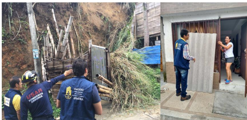
En Armenia, se trabaja en la mitigación del riesgo.

· $ 587.106.800, se han invertido a la fecha por la UNGRD.