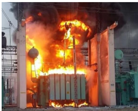
Fig. 6 Incendio en Transformador de Potencia

https://zensitec.com/sistemas-contra-incendios/extincion-por-agua/sistemas-contra-incendios-en-transformadores