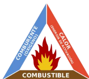
Fig. 4. Triangulo del fuego_ Ref. aelaf.es

El fuego se desencadena cuando estos factores se combinan en la proporción adecuada, el triángulo es de gran utilidad para explicar cómo podemos extinguir un fuego eliminando uno de los lados del triángulo.