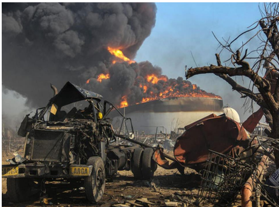
Fig. 1 Incendio Tocoa – Venezuela