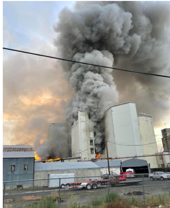
Fig.11. Incendio en Molino de Harina

https://telemundoyakimatricities.com/incendio-destruye-un-molino-de-harina/