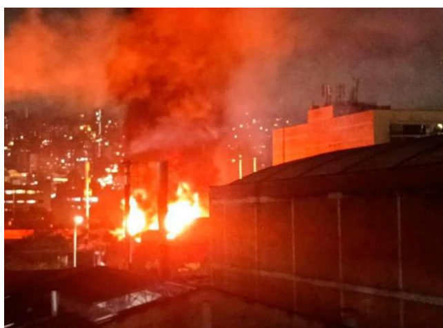
Fig. 7. Incendio en bodega de almacenamiento de plásticos https://www.elcolombiano.com/antioquia/

En este tipo de incendios, es habitual emplear estrategias de suspender el aporte y la pérdida de continuidad antes de atacar el incendio en sí mismo. Otras veces, en función de la compactación que tenga el sólido que se está quemando, convendrá dejarlo arder de forma controlada y limitando la propagación del mismo al entorno inmediato.