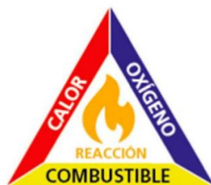
Fig. 5 Tetraedro del fuego_ Ref. 2020 Melisam Fire Group.

Actualmente se ha descubierto que para que se mantenga la combustión es necesario un cuarto elemento que es la reacción en cadena. El triángulo del fuego explica cómo se produce el fuego y es el tetraedro del fuego el concepto que explica cómo dicho fuego puede propagarse y tener continuidad.