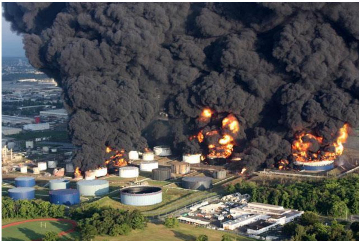
Fig.9. Incendio de Tanque

https://docplayer.es/190650259-Incendios-en-liquidos-inflamables-y-combustibles-brigada.html