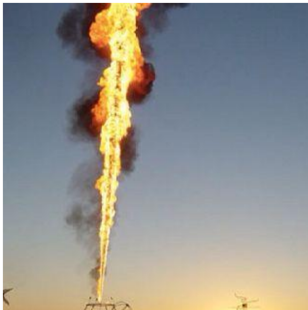
Fig.10. Jet Fire

https://essd.com.co/blog/f/%C2%BFqu%C3%A9-es-el-jet-fire