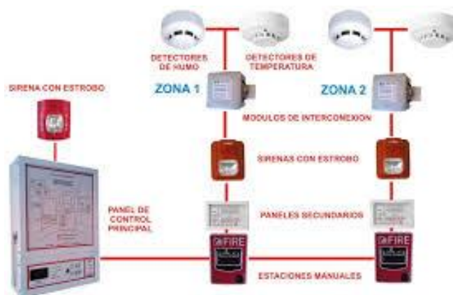
Fig.13. Sistema de detección de incendio_ http://www.apmcontrol.com/