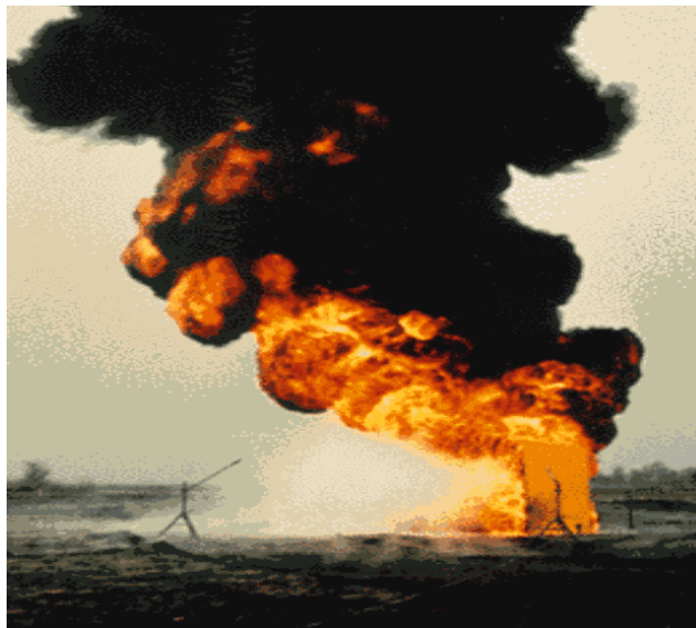
Fig. 8 Incendio de charco o Pool Fire https://guiar.unizar.es/1/Accident/An_conse/Charco.htm