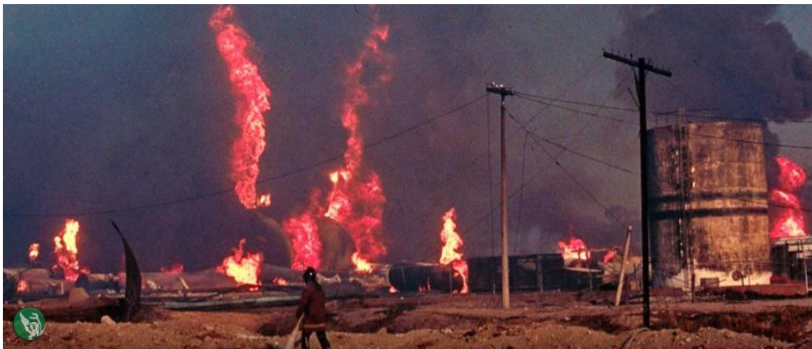
Fig. 2 Incendio San Juan de Ixhuatepec, Mexico https://proteccioncivilsanluis.gob.mx/