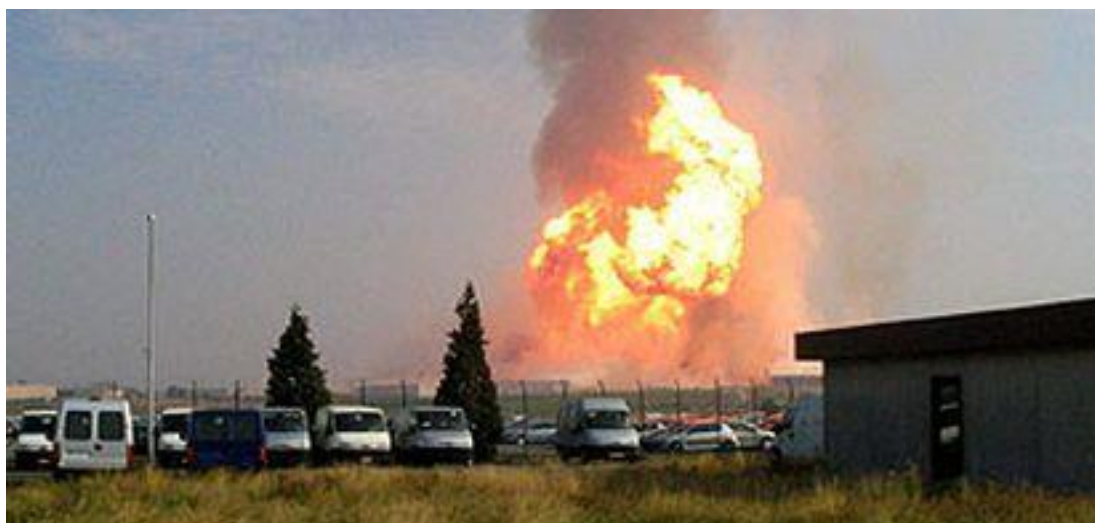
Fig. 3 Explosión e Incendio en Ghent – Belgica, https://elpais.com/diario/2004/07/31/internacional/