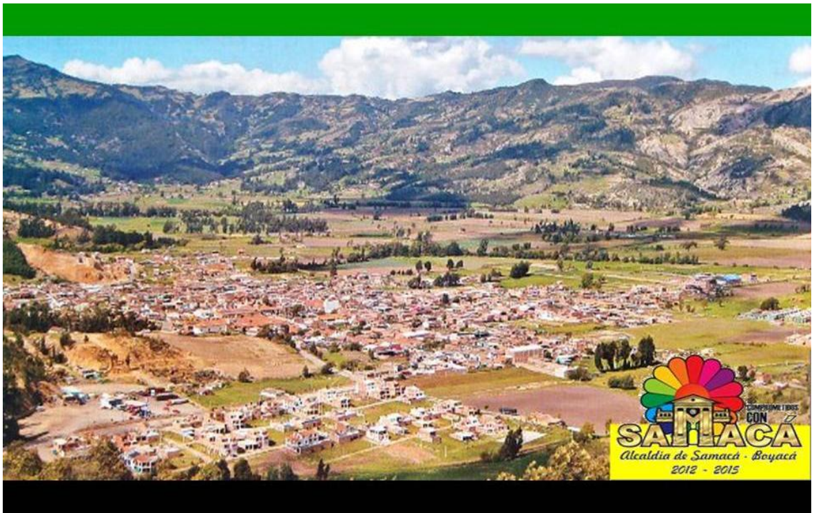
febrero de 2011

Consejo Municipal de Gestión del Riesgo de Desastres CMGRD