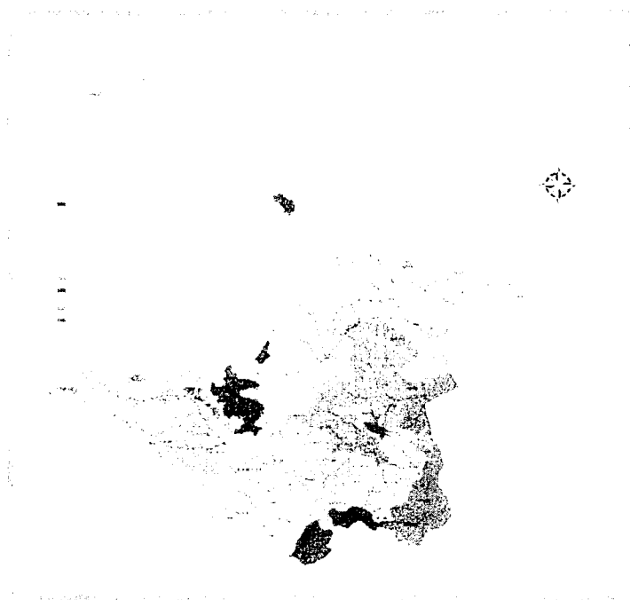
Figura 1. Localización del Municipio de Timbío en el Departamento del Cauca

EXTENCION La superficie del Municipio de Timbío comprende una extensión de 20.158 Has (201.5 Km 2 ), donde el 99.4% (203.7Km 2 ) corresponde a la extensión rural y el 0.6%, equivalente a 1.3Km 2 es extensión urbana. Cuenta con altitudes comprendidas entre 1000 y 2000 metros sobre el nivel del mar. Región Sub-andina y piso térmico templado húmedo (TH), con una temperatura que oscila entre 16 y 23°C y una precipitación promedio de 2026.5 mm. La superficie territorial del Municipio corresponde aproximadamente al 0.7 % de total del territorio del Departamento