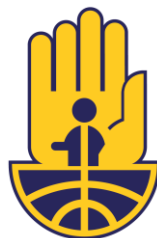
Sistema Nacional de Gestión del Riesgo de Desastres