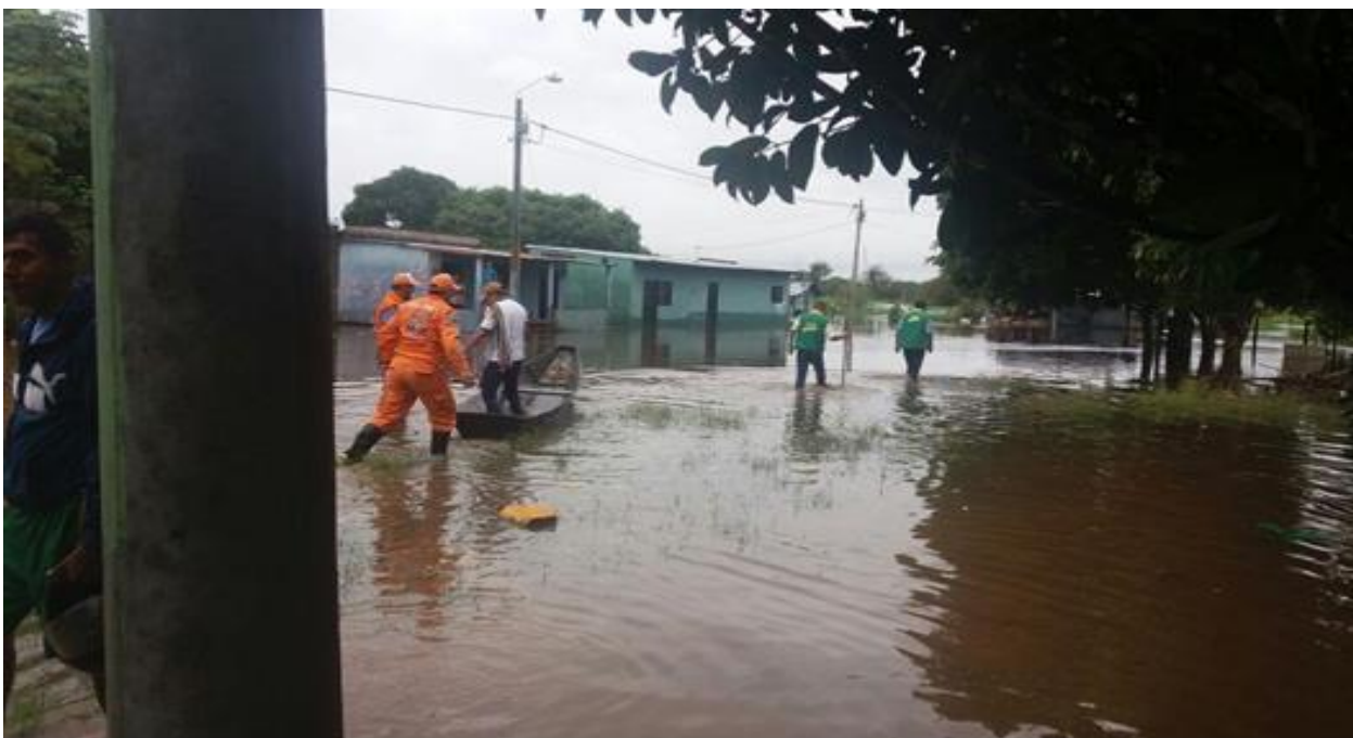
Barrio Santa Teresita, julio de 2016