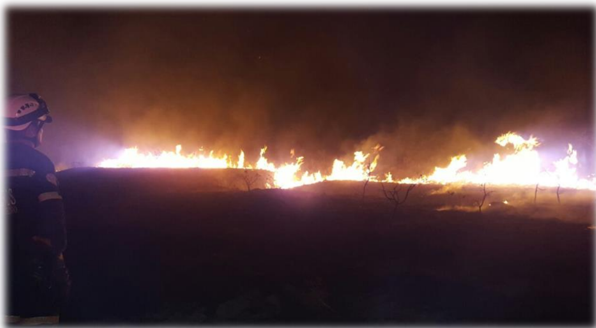
Incendio forestal en la finca La Pradera, Reforestadora FINLANDES SAS, febrero de 2017

Descripción del fenómeno amenazante: El fuego que se inicia por tres causas básicas en fincas, en pastizales y directamente en los bosques de galería, y pueden clasificarse en incendios de superficie: ocurren a ras de suelo quemando hierba, pastos, matorrales, arbustos y demás vegetación menor. Incendios de copa: se propagan por la parte superior de los árboles. Incendios subterráneos: se producen bajo la superficie, quemando raíces y materia orgánica, para su detección se requieren grandes esfuerzos por parte de las brigadas.