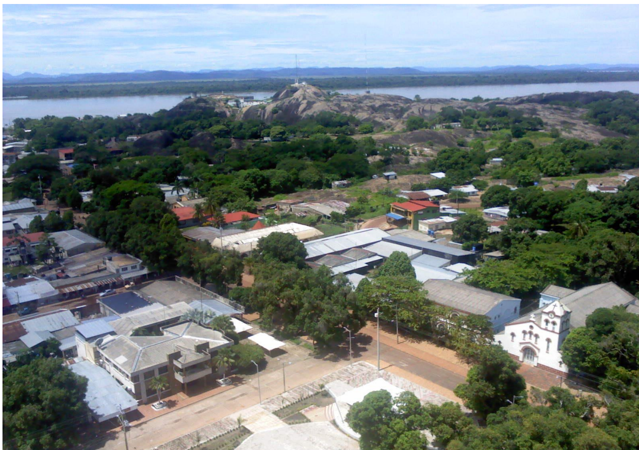
Panorámica Municipio de Puerto Carreño