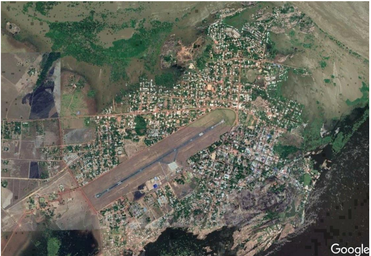
Imagen de Google Earth 2019