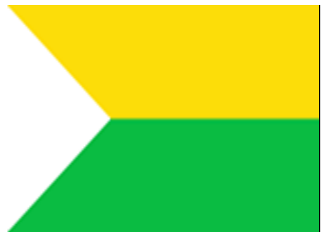
Bandera del Municipio