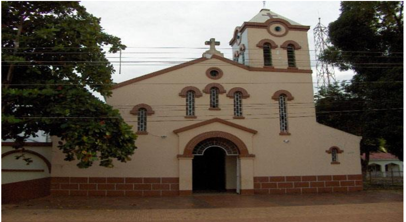
Catedral Nuestra Señora del Carmen-Puerto Carreño.