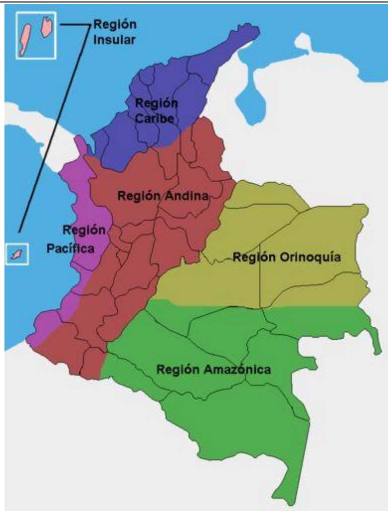
Fig xxx Angostura con respecto la ubicación geografica Nacional