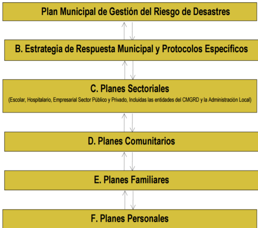
Figura 1: Jerarquía de los planes, extractado de Guía Metodológica para la Elaboración de la Estrategia de Respuesta Municipal - UNGRD -2013

Ahora bien, Un plan es una intención o un proyecto. Se trata de un modelo sistemático que se elabora antes de realizar una acción, con el objetivo de dirigirla y encauzarla. En este sentido, un plan también es un escrito que precisa los detalles necesarios para realizar una obra 5 . En nuestro caso los planes que diseñamos están enmarcados con objetivos enfocados a prevenir, mitigar y dar respuesta a eventos adversos. Hablando de esos un buen ejemplo es la figura 1, donde vemos la jerarquía de los planes usados actualmente en nuestro país para apoyar la gestión integral del riesgo de desastres en cada uno de los niveles gubernamentales de nuestro país.