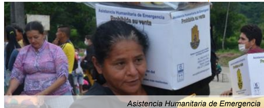
Asistencia Humanitaria de Emergencia