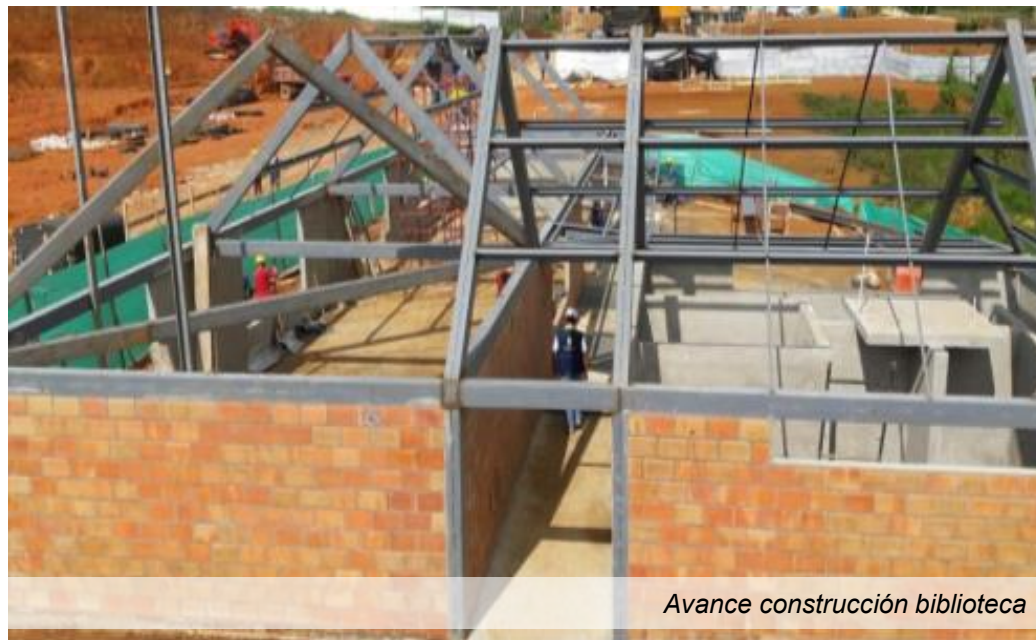
Avance construcción biblioteca