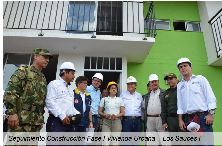
Seguimiento Construcción Fase I Vivienda Urbana – Los Sauces I