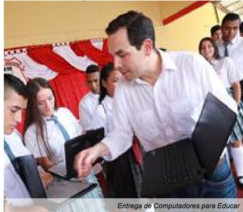
Entrega de Computadores para Educar