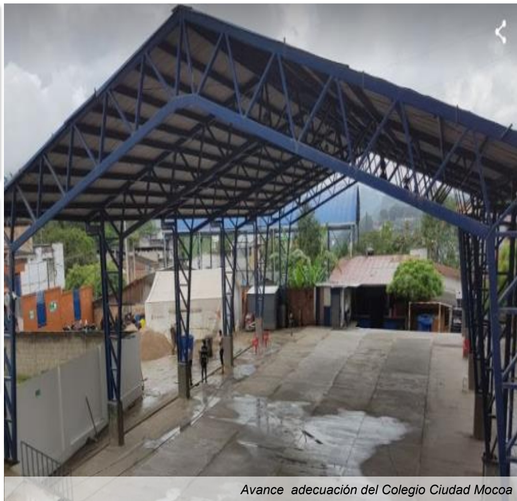
Avance adecuación del Colegio Ciudad Mocoa

Tiempo de ejecución: 3 meses (Enero-Marzo 2018)