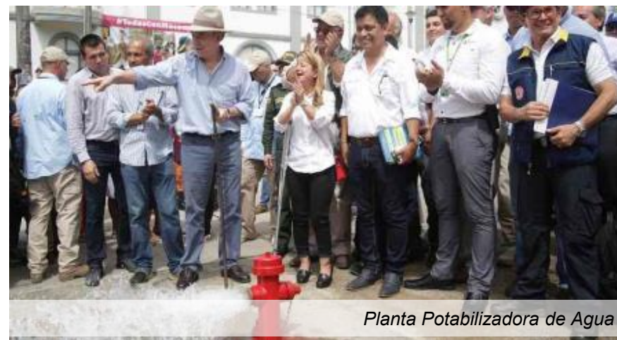
Planta Potabilizadora de Agua