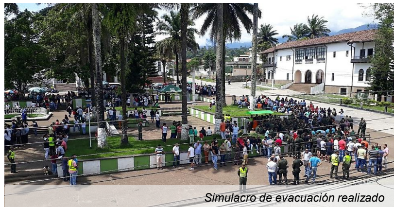
Simulacro de evacuación realizado