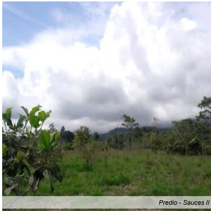
Predio - Sauces II