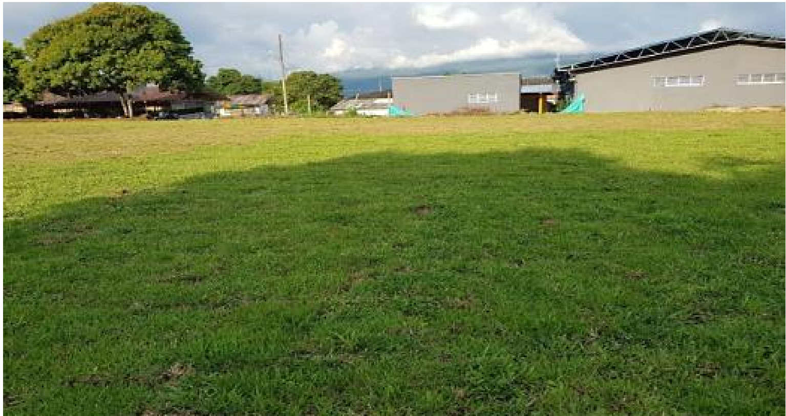
Cancha Deportiva el Pepino

3 meses (Septiembre 2017 a Diciembre 2017)