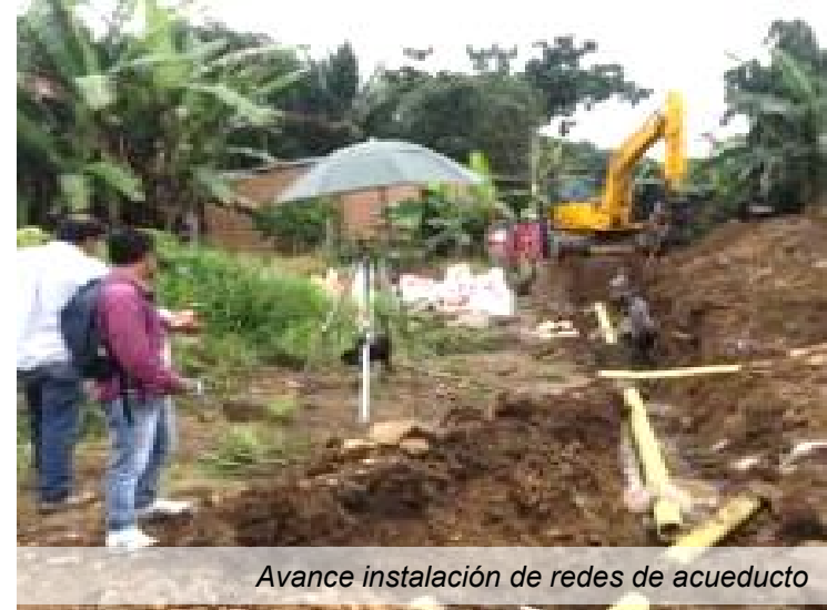
Avance instalación de redes de acueducto