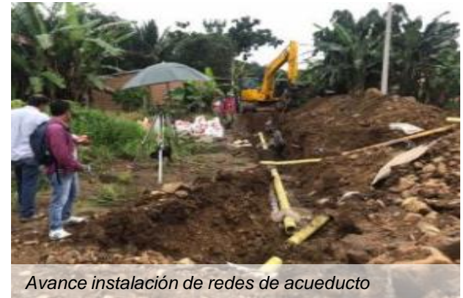
Avance instalación de redes de acueducto