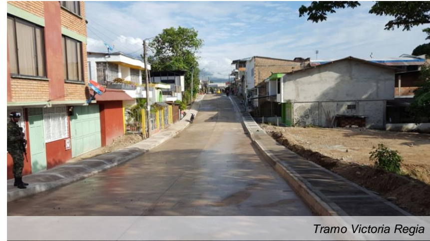
Tramo Victoria Regia