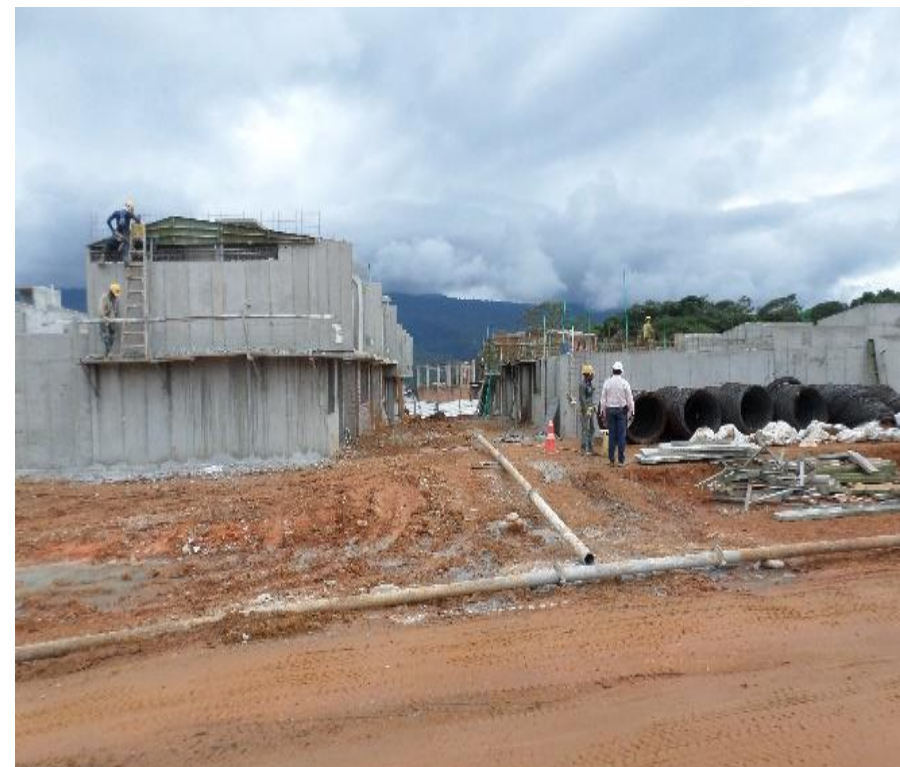
Avance de construcción Fase I Vivienda Urbana – Los Sauces I

Tiempo de ejecución: 1 año (Mayo 2017- Mayo 2018)