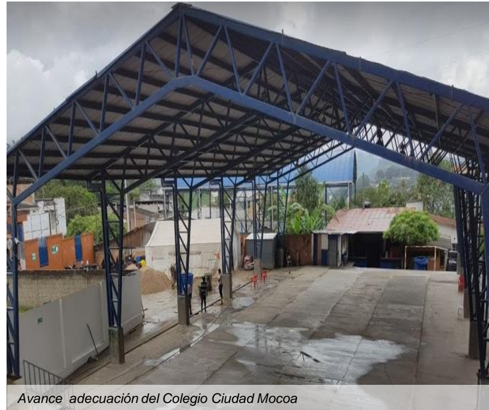
Avance adecuación del Colegio Ciudad Mocoa