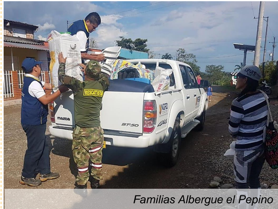
Familias Albergue el Pepino