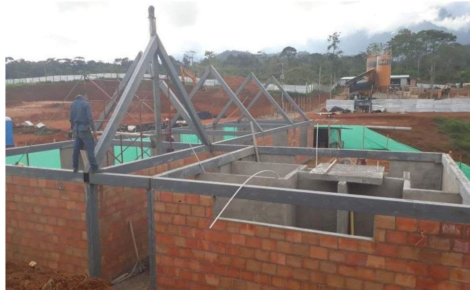
Avance construcción biblioteca