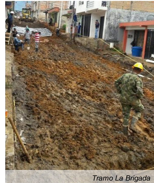
Tramo La Brigada