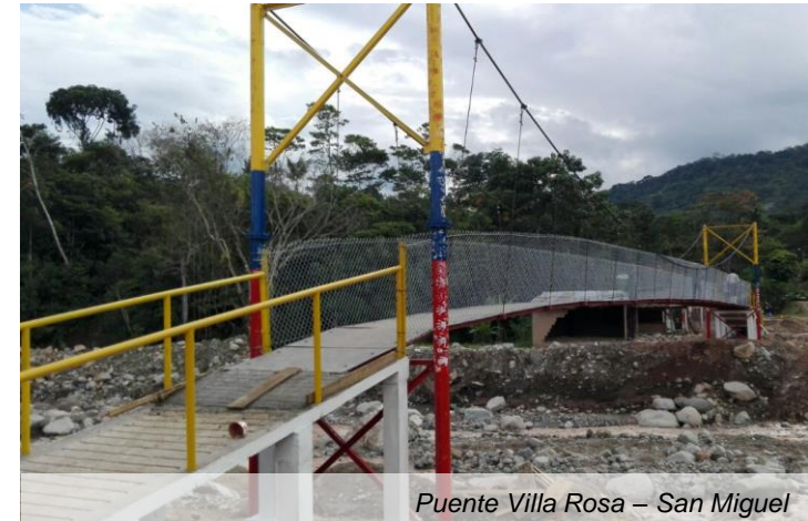
Puente Villa Rosa – San Miguel