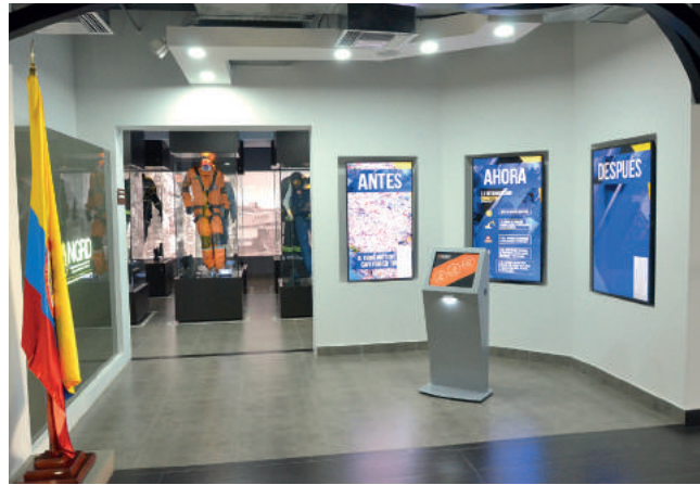
Museo del Saber en Gestión del Riesgo de Desastres.

Por otra parte, la UNGRD responde también a lo que el Secretario General de este organismo internacional ha denominado “Sendai siete”, una cam-