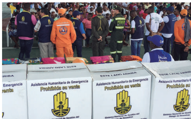
Atención del SNGRD por inundación en Novita, Chocó.