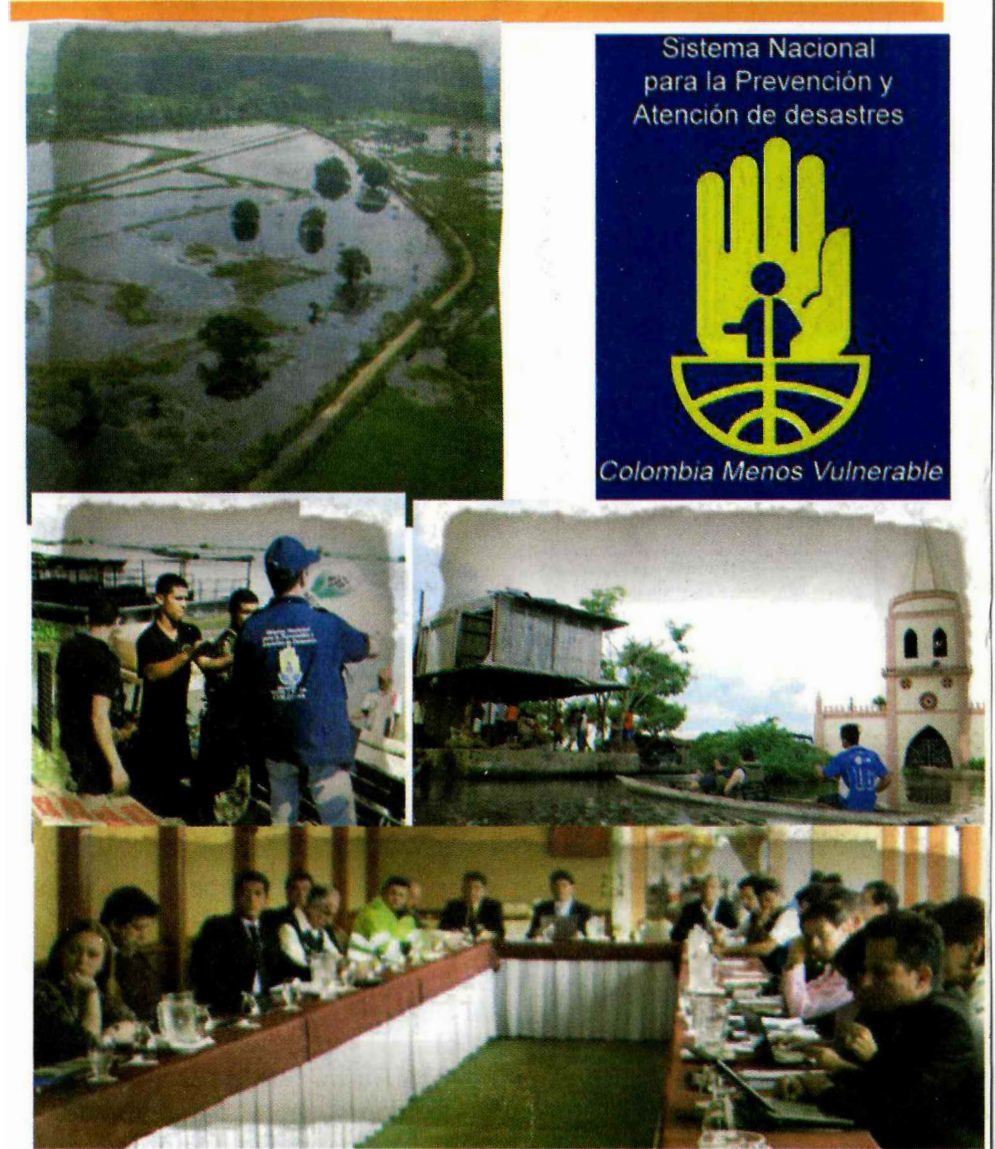
COMITE OPERATIVO DEL SISTEMA NACIONAL PARA LA PREVENCIÓN Y ATENCIÓN DE DESASTRES SEPTIEMBRE 2 DE 2011