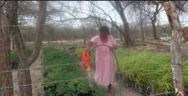
Proyecto fortalecimiento de la actividad productiva ovino-caprina como fuente de seguridad alimentaria y nutricional de las comunidades Indígenas Wayuu de Riohacha Afectadas por la Ola Invernal 2012-2013. Riohacha (Guajira), 2013.

“Medios de vida es un sector que permite ampliar el enfoque de actuación del SNGRD desde el socorro hacia la resiliencia”