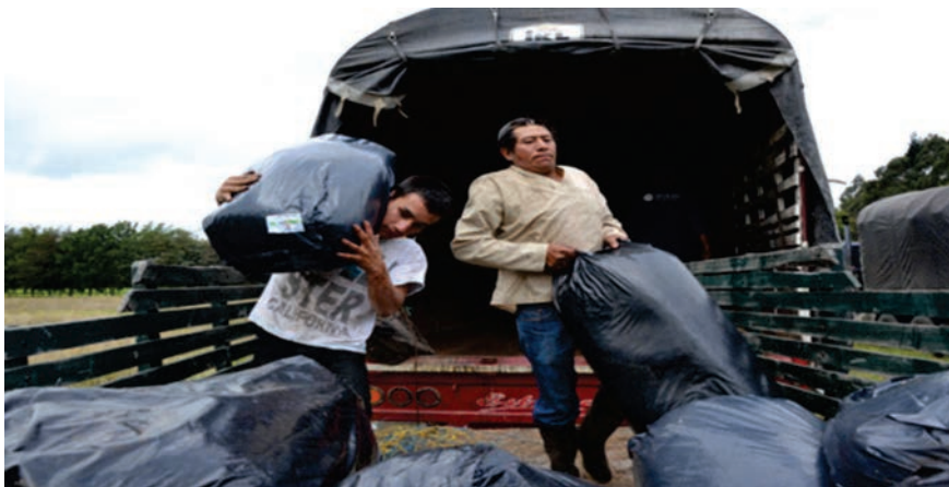
Entrega de suplemento para ganado. Municipio de Tenjo (Cundinamarca), 2015.

Las amenazas naturales, los desastres y el impacto del cambio climático ponen en riesgo los medios de vida de las personas y hacen aún más vulnerables los ya debilitados. Este tipo de fenómenos suelen agotar o deteriorar los recursos productivos, el contexto y las funciones normales de las instituciones que regulan las actividades productivas, principalmente mercados y servicios financieros.