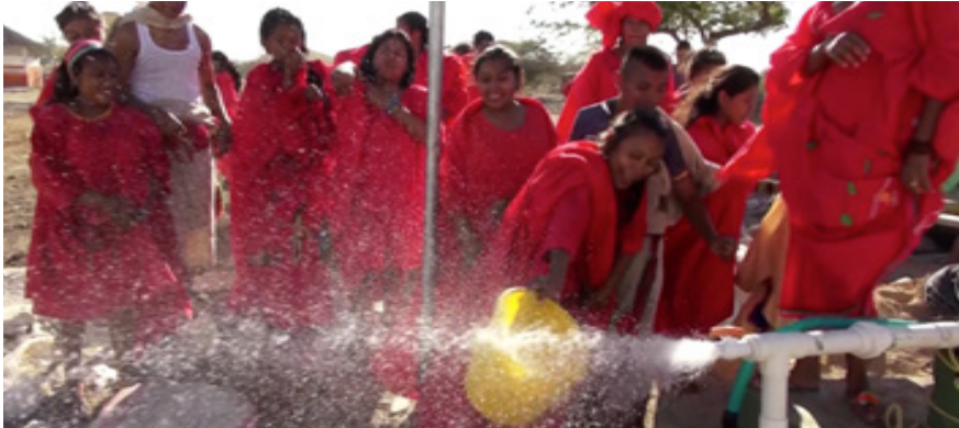
Acciones de recuperación en temporada seca. (Departamento de la Guajira), 2015.