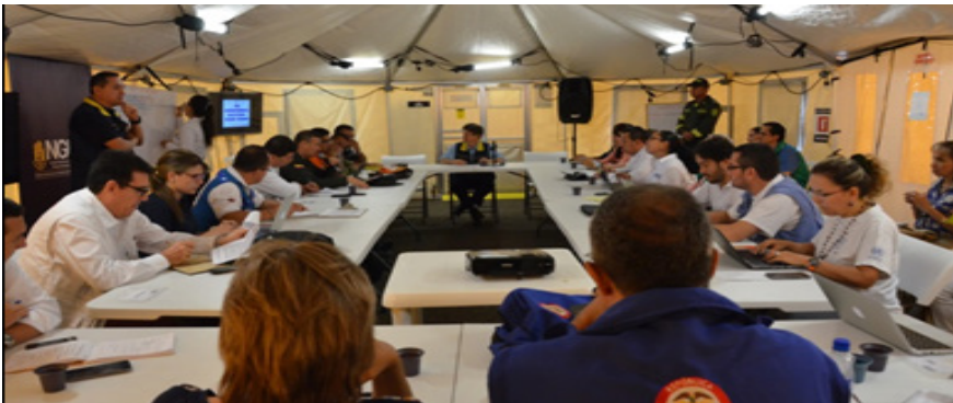
Atención emergencia frontera con Venezuela, Cúcuta (Norte de Santander), 2015.