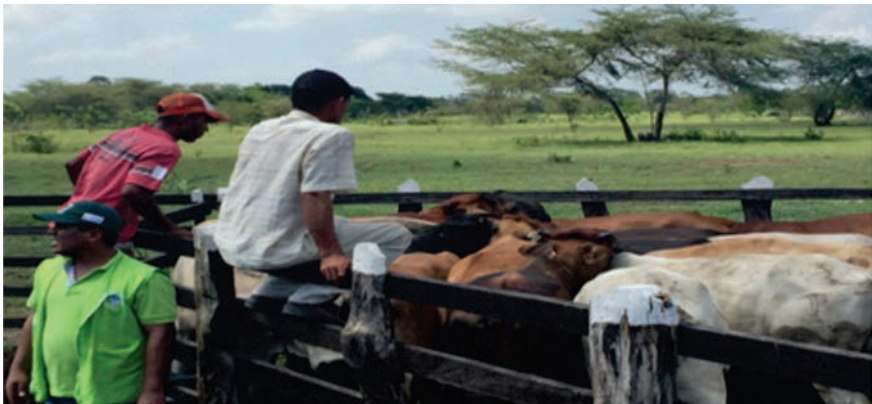
Proyectos especiales entrega de bovinos. (Departamento de Atlántico), 2015.