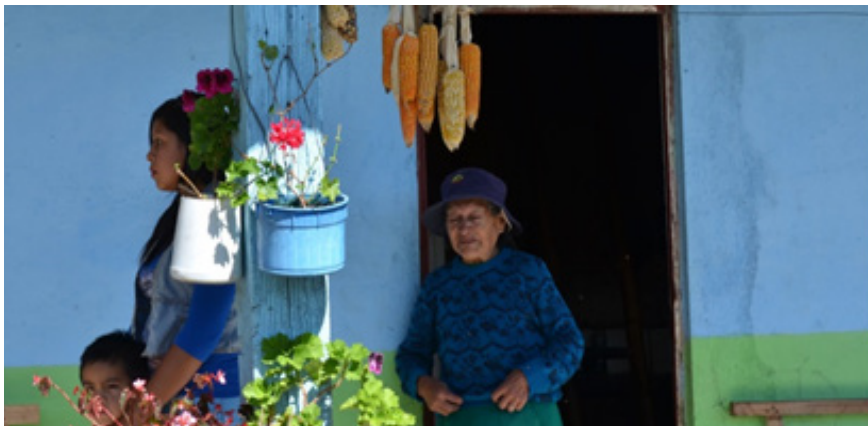
Programa Galeras – seguridad alimentaria. Pasto (Nariño), 2015.

Integrar en las acciones de la función de manejo de desastres, las medidas necesarias para garantizar una actuación humanitaria que permita satisfacer la seguridad alimentaria y la protección, recuperación y rehabilitación de los medios de vida de la población, en todas las fases del manejo de emergencias.