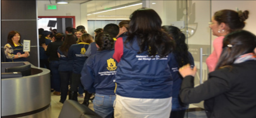
Evacuación de una edificación. Bogotá D.C (Colombia), 2014.