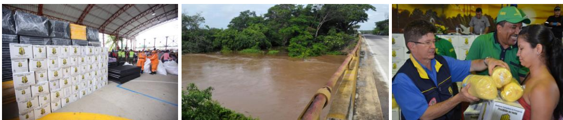
Atención y seguimiento a las situaciones de emergencia presentadas en esta Temporada de Lluvias

Bogotá, 13 de mayo de 2016 (@UNGRD). 289 eventos se han presentado desde el primero de abril hasta la fecha como consecuencia de la primera Temporada de Lluvias del año 2016, dejando 5.881 familias afectadas.